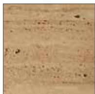
Travertino / Travertine T. ROMANO / Roman T. Finitura opaca / Matt finish