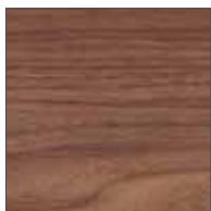
Legno / Wood Noce Canaletto / Black Walnut Finitura a cera / Wax finish