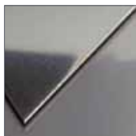
Metallo / Metal Acciaio / Steel Finitura lucida / Shiny finish